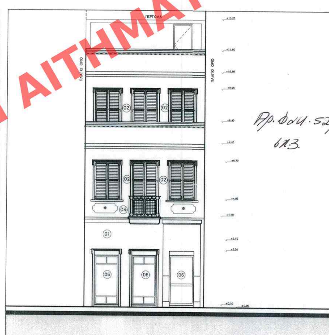
ΟΨΗ ΟΔΟΥ ΜΥΚΩΝΟΣ

ΕΔΗΜΟΣΙΕΥΘΗ ΕΙΣ ΤΟ ΥΠ' ΑΡΙΘΜ. 138... ΦΥΛΛΟ ΤΟΥ Β.97... ΤΕΥΧΟΥΣ ΤΗΣ ΕΦΗΜΕΡΙΔΑΣ ΤΗΣ ΚΥΒΕΡΝΗΣΕΩΣ ΤΗΣ 21.9.2007