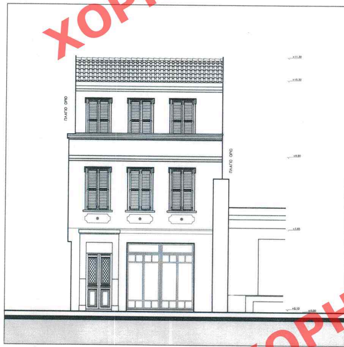
ΟΨΗ ΟΔΟΥ ΑΙΩΣΠΟΥ - ΔΙΑΤΗΡΗΤΟ